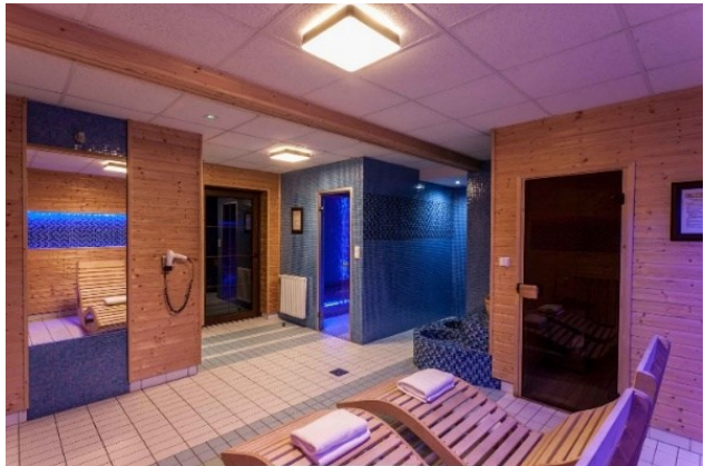
Sauny w Gościńcu nad Potokiem