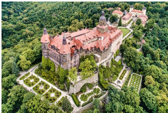
Zamek w Książu