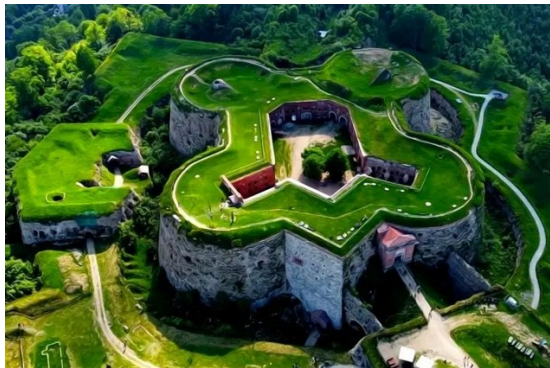
Twierdza Srebrna Góra