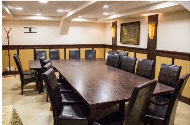
Sala konferencyjna w Gościńcu nad Potokiem