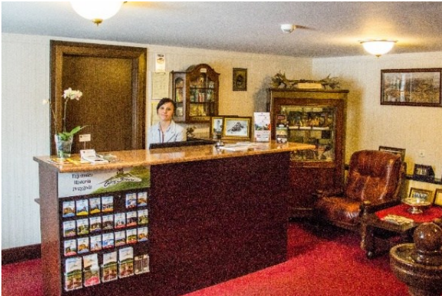
Recepcja w Gościńcu nad Potokiem