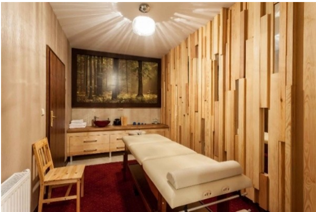
Salon masażu w Gościńcu nad Potokiem