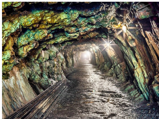
Sztolnie na szlaku Projektu RIESE