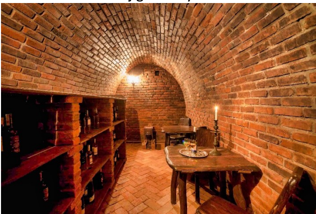
Piwniczka z winami przy Domu Myśliwskim